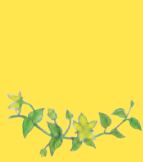
poléhavý nebo plazivý