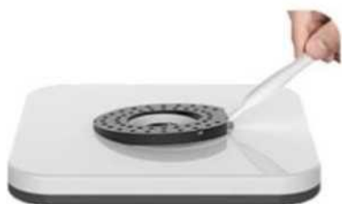
Usuń filtr za pomocą narzędzia

Zalecamy również wymianę filtra co 30 dni.