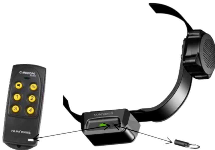
Schéma 4: Aktivujte/deaktivujte obojek přijímače pomocí magnetickým klíčem nebo dálkovým ovladačem

Deaktivace: posuňte magnetický klíč nebo šedý obdélník dálkového ovladače směrem k obojku tak, aby se dostal do kontaktu se symbolem, podržte po dobu 1 sekundy (schéma 4). Na obojku se rozsvítí kontrolka bliká ze zelené na červenou a poté zhasne, což znamená, že obojek je vypnutý.