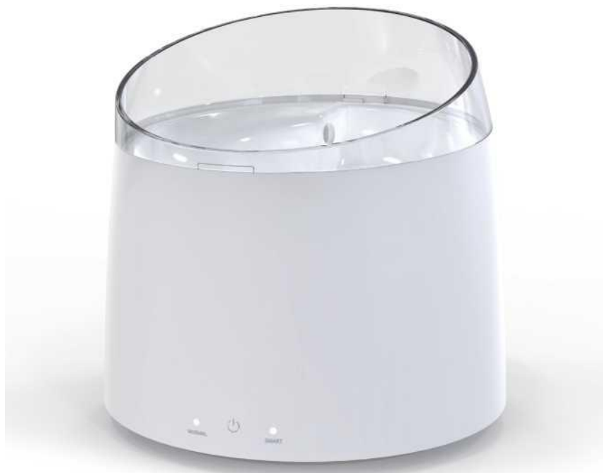
Smart Pet Poideľko