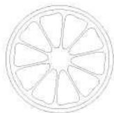
Pakiet Antybakteryjny (Opcjonalny )