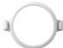
POGUMOVANÉ UCHYTENIE NA OBOJOK