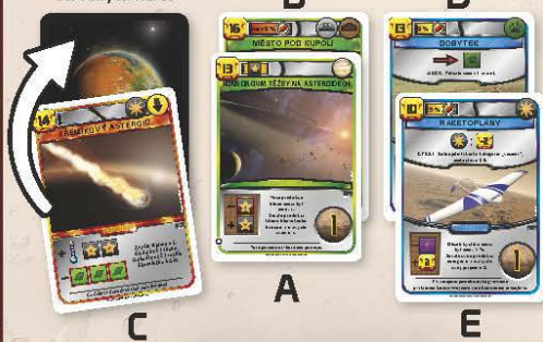
Odkládací balíček červených karet

Mnoho karet představuje různé teraformační projekty. Některé ovlivňují hlavní faktory, jiné zlepšují váš TR jiným způsobem. Jistá karta může představovat fotosyntetizující organismy uvolňující kyslík, jiná zdroj tepla způsobující postupný nárůst teploty.