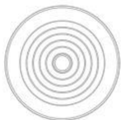
Miska na vodu