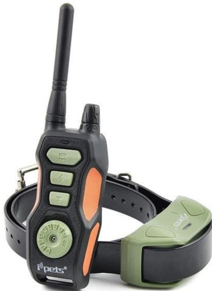
Benutzerhandbuch Petra Trainer PET618