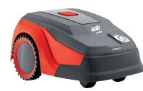
Robolinho® 700 I Art. 127 447