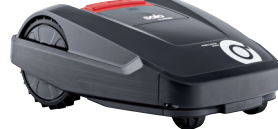
Robolinho® 3100 I Art. 127 478