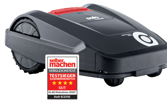
Art. 127 405 Art. 127 478 inTOUCH

Der Robolinho® 3100 / 3100 I mäht Rasenflächen bis 1.200 m 2 vollautomatisch und sicher. Zur serienmäßigen Ausstattung des Gerätes gehören neben der Doppelmesser-Technologie auch ein Regensensor und die Möglichkeit, verschiedene Einstiegspunkte frei auszuwählen. So werden auch schwer zugängliche Bereiche im Garten zuverlässig gemäht. Der Mähroboter kann mit einer zweiten Basisstation auf einer separaten Fläche betrieben werden.