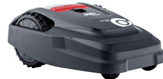
Art. 127 404 Art. 127 477 inTOUCH

Der Robolinho® 1100 / 1100 I bringt mit seinen bunten Wechselhauben nicht nur Farbe in Ihren Garten, sondern kümmert sich auch zuverlässig um die Pflege von Rasenflächen bis 700 m 2 . Die Doppelmesser-Technologie sorgt dabei stets für eine natürliche Düngung, da der Grasschnitt direkt im Mähgehäuse feingehäckselt und in den Rasen zurückgeblasen wird.