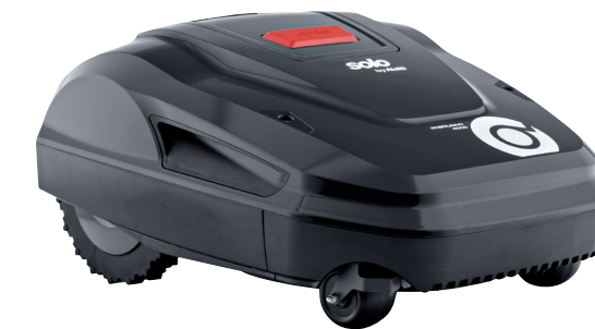
Art. 127 406 Art. 127 479 inTOUCH

Das größte Mitglied der Robolinho®-Familie überzeugt durch eine Flächenleistung bis 2.000 m 2 und eine besonders effiziente und umweltschonende Arbeitsweise. Die Bedienung erfolgt komfortabel über das übersichtliche LCD-Display, die Schnitthöhenverstellung elektronisch per Knopfdruck. Leistungsfähige Antriebe, die gute Traktion der Antriebsräder und eine große Bodenfreiheit gewährleisten zudem den vollautomatischen, täglichen Betrieb.