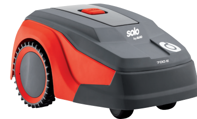
Art. 127 446 Art. 127 447 inTOUCH

Klein, kompakt und agil. Der Robolinho®700 E / 700 I schafft mit seinen stark profilierten Antriebsrädern Steigungen bis zu 45%. Die große Bodenfreiheit erlaubt es ihm auch in höherem, dichten Gras zu arbeiten. Das Doppelmessermähwerk mit seinen Wendeklingen bringt im Rechts- und Linkslauf eine 4-fach längere Standzeit.