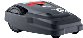
Robolinho® 1100 I Art. 127 477