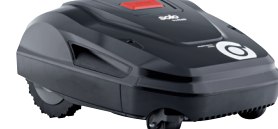
Robolinho® 4100 I Art. 127 479