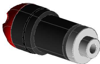
Adaptér Šroub M10x1,25-100 Podložka M10