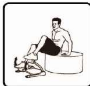
Jízda na kole