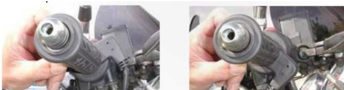
poloha zavřeného plynu