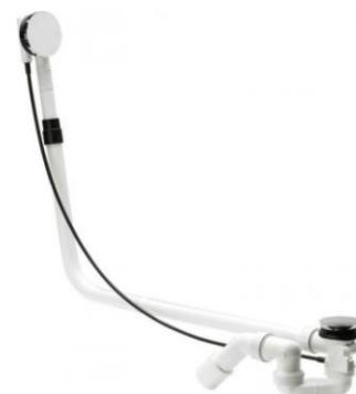
konstrukce automatické výpušti.

Objem 350 - 400 l vody, solné, pивní či vinné lázně, ledu (dle skupenství).